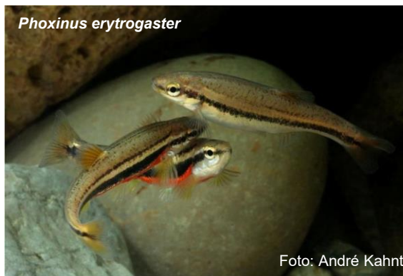
Phoxinus erythrogaster

Vortrag von Herrn André Kahnt, Altenburg