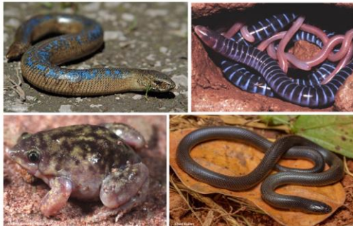
Diverse Vertreter der globalen Untergrundherpetofauna

Naturkundemuseum Potsdam Breite Str. 13, 14467 Potsdam