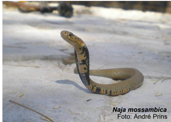
Naja mossambica